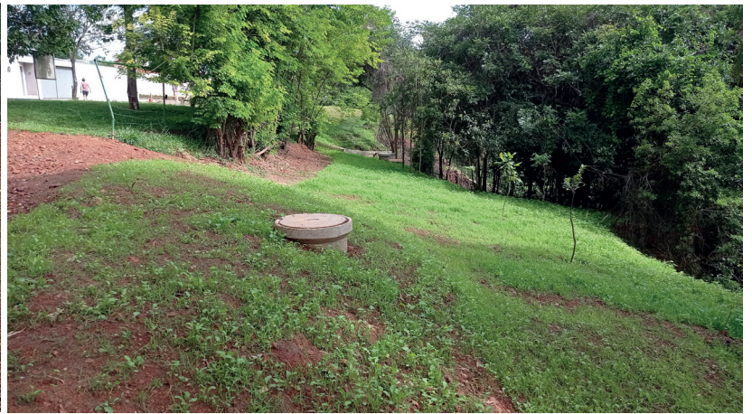
Recuperação das erosões 1 e 2. Reaterro, plantio de árvores e gramíneas