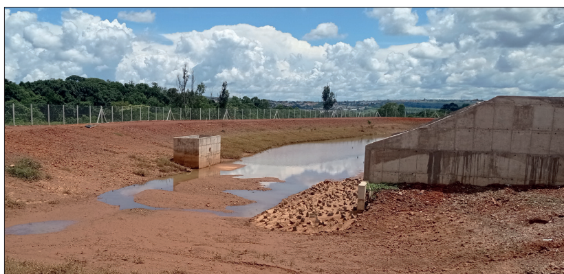
Bacia, dissipador e caixa extravasora