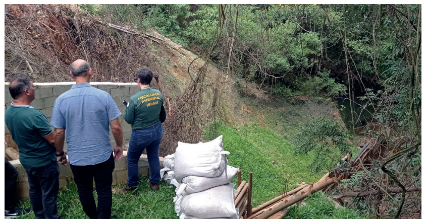
Visita do Ibram