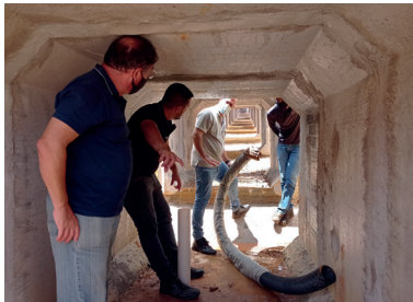
Acompanhamento de todos os passos pelo RK e engenheiros responsáveis pela obra