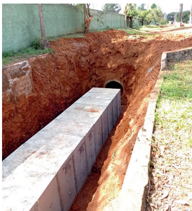
Adequação da rede interna para interligação com a rede externa