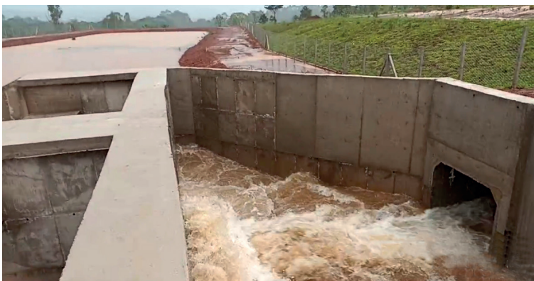
Dissipador e bacia em pleno funcionamento