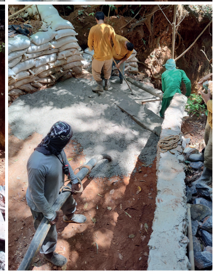
Erosão 2 - Trabalho de recuperação das encostas da erosão com paliçadas e rip-rap. Concretagem do fundo do canal para evitar futuras erosões