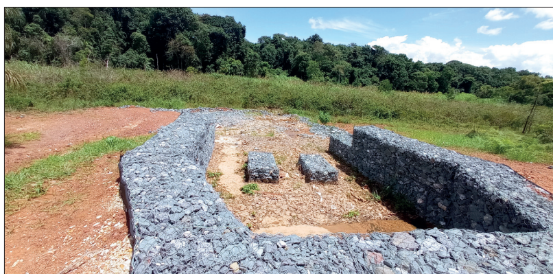
Emissário de lançamento final