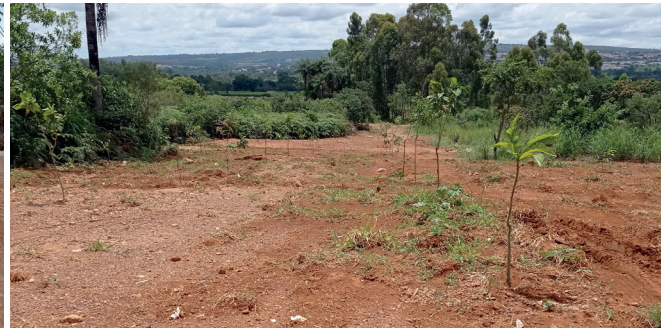
Recuperação da erosão 4. Com a abertura da rede Centauros foi possível fazer a recuperação da erosão com reaterro e plantio de árvores e gramíneas