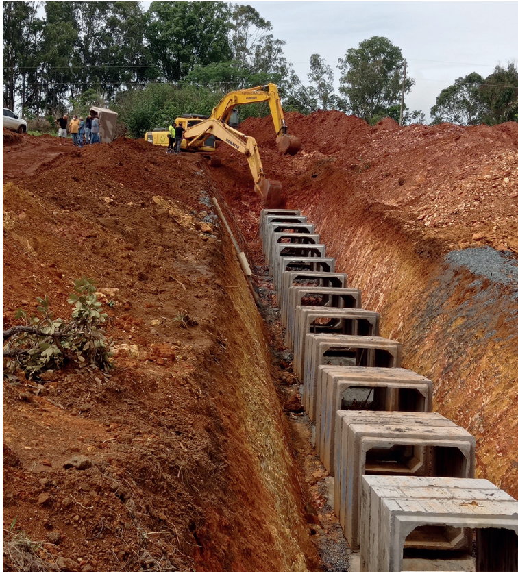
Galeria 1,65 x 1,65m quando estava em construção