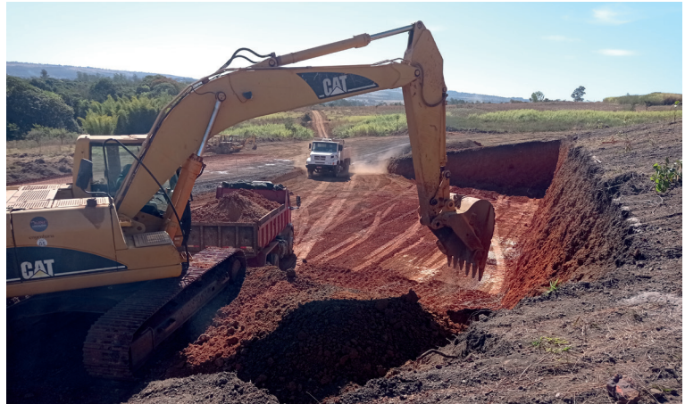
Início da escavação da bacia do Antares