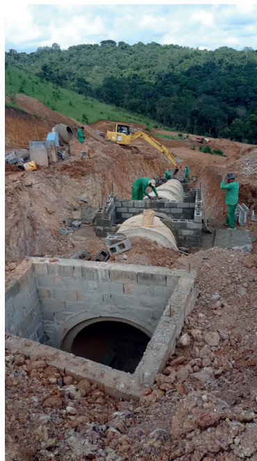
Rede com degraus e caixas de visita para manutenção