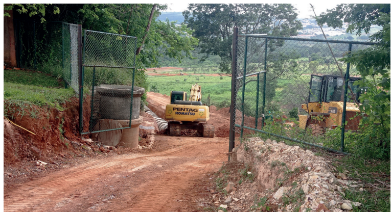
A rede de macrodrenagem já está chegando ao ponto de ligação com a microdrenagem