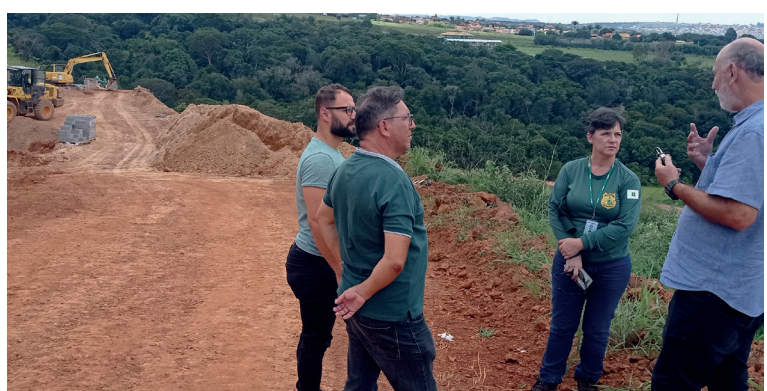
Visita do Ibram. Relatórios periódicos são elaborados e enviados para Ibram, MP e Novacap