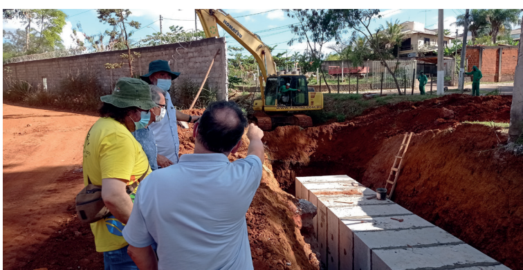
Visita do Ibram. Todas as etapas da obra tiveram acompanhamento dos órgãos responsáveis