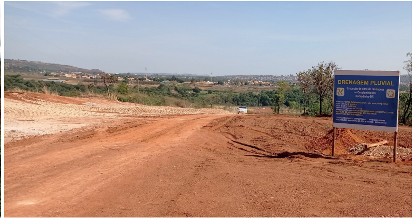
Recuperação da erosão 5. Após a construção da galeria de 1,65 x 1,65m foi feito o reaterro da área da obra e da erosão para fazer o plantio de árvores e gramíneas